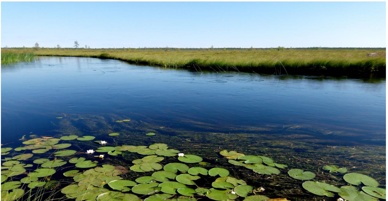
Kuva Noora Kauppila